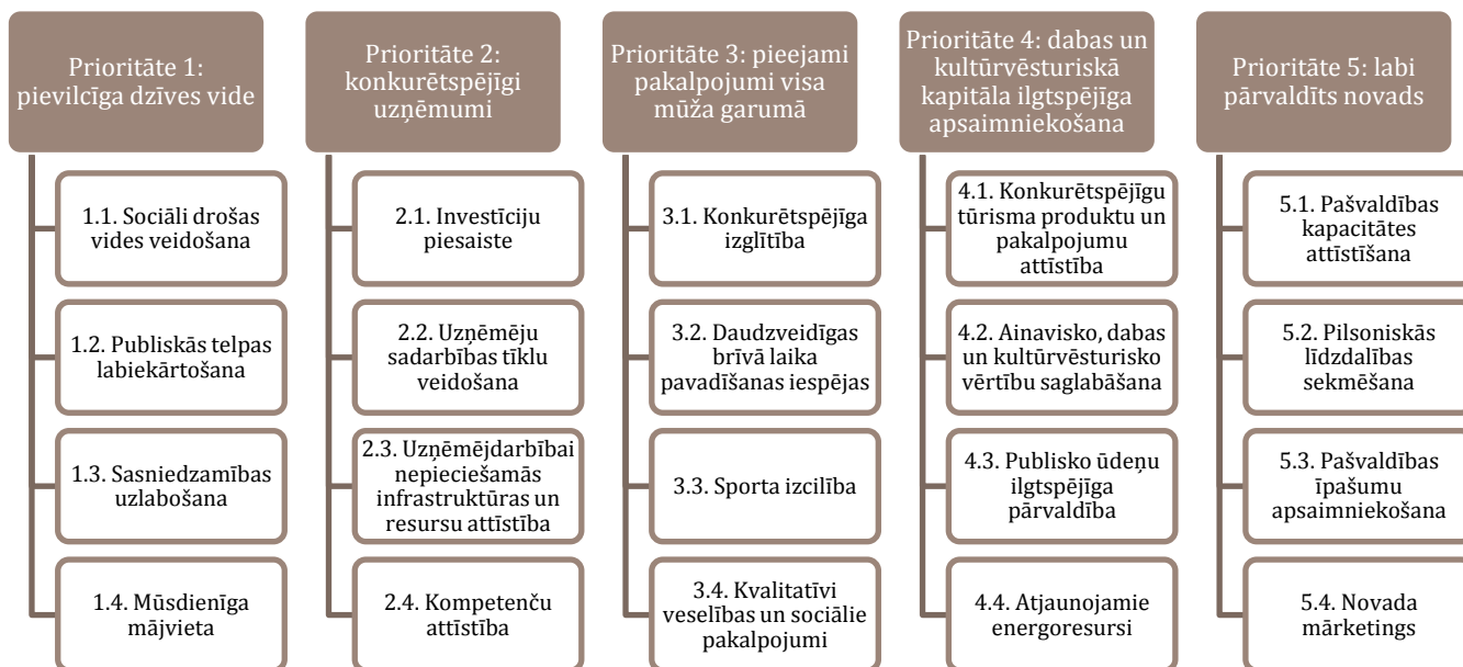
Attēls nr. 4. Prioritātes un rīcības virzieni

Katrai no piecām prioritātēm izvirzīti četri vidēja termiņa rīcības virzieni. Rīcības virzieni iezīmē jomas, kurās ir būtiski investēt novada mērķu sasniegšanai un vīzijas īstenošanai.